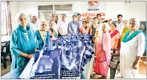
शहजादपुर। बुजुर्गों को सामान भेंट करते हुए चेयरमैन व अन्य।