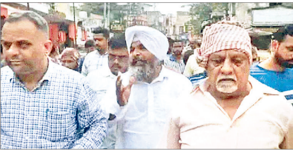
अंबाला। निगम अधिकारियों के खिलाफ प्रदर्शन करते लोग।

बरसाती सीजन में ओवरफ्लो हो जाता है नाला, लोगों का आरोप नाला ओवरफ्लो होने से घरों में घुसता है गंदा पानी