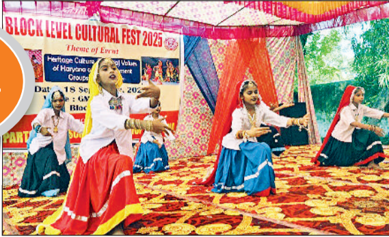
इंद्री। खंड स्तरीय सांस्कृतिक महोत्सव में प्रस्तुति देती छात्राएं।