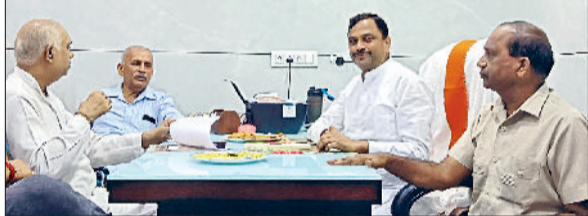
इंद्री। इंद्री अनाज मंडी में मीटिंग करते कार्यकारी सदस्य।