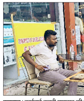
करनाल। कार्रवाई करती प्रशासन की टीम।