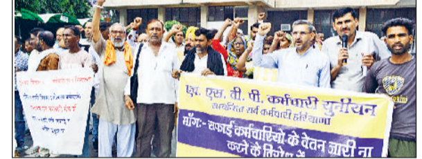
करनाल। मांगों को लेकर प्रदर्शन करते कच्चे सफाई कर्मचारी।