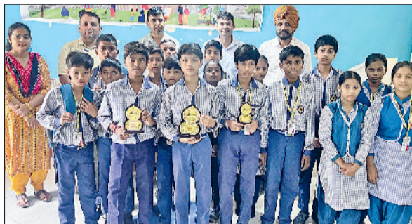
पानीपत। विरासत की हिफाजत पेंटिंग प्रतियोगिता के विजेता विद्यार्थी अतिथियों के साथ।